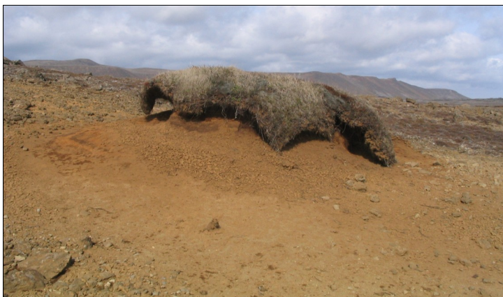
Rofið land í Krýsuvík