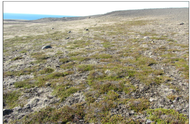
Uppgróið land niður undir Krýsuvíkurbjargi

Á haustdögum 2013 var gerð úttekt á gróðurfari og jarðvegsrofi innan beitarhólfs Hafnfirðinga í Krýsuvík, með því að kortleggja svæðið samkvæmt kortlagningarlykli Landgræðslunnar. Kortlagningin var unnin á vettvangi ofan á SPOT geritungalmýndir frá 2007 í mælikvarða 1:10.000. Megin þættir kortlagningar eru gróðurþekja, jarðvegsrof, sandur á yfirborði og grjót á yfirborði (sjá nánar kort 1 – 4 í viðauka 2). Kortlagningin sem Landgræðslan gerði sl. haust er sú fyrsta sem hún gerir í beitarhólfinu.