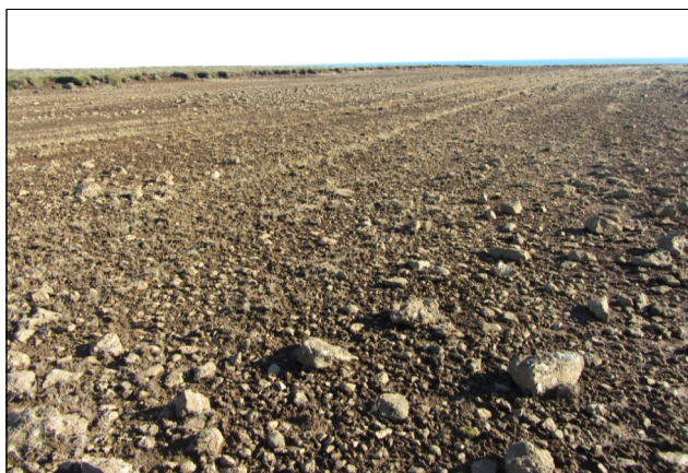
Landsvæði í Krýsuvík sem þarfnast uppgræðslu

Lögð verði áhersla á að halda áfram að styrkja gróðurþyr svæði innan beitarhólfsins og gera gróður sjálfbæran, sjá kort nr. 5 í viðauka. Lagt er því til að unnið verði á um 75 ha árlega næstu 10 árin, en það svarar til dreifingar á 15 tonnum af áburði árlega auk grasfræs. Heildarkostnaður við þá framkvæmd á ári er um 2 mkr. á verðlagi ársins 2013. Áætlun þessi er sett fram með fyrirvara um fjármögnun verkefnisins og almennar verðlagsbreytingar.