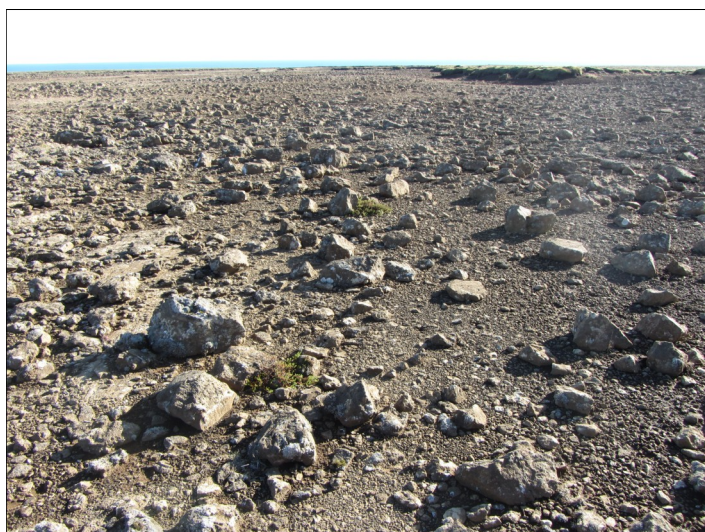
Hluti af landinu í Krýsuvík er mjög grýttur og ekki hægt að vinna á því svæði

Þrátt fyrir að unnið hafi verið að uppgræðslu í Krýsuvík í 25 ár hafa markmið hennar ekki enn að fullu náðst. Í töflu 1 eru upplýsingar um gróðurþekju í beitarhólfinu en þar kemur m.a. fram að um 640 ha eru enn hálfgrónir eða minna grónir. Þessi svæði þarf að græða upp, en af þeim eru um 390 ha sem ekki er talið gerlegt að vinna á sökum halla og grjóts á yfirborði. Eftir standa því um 250 ha sem á eftir að vinna á. Sjá kort 5 í viðauka 2.